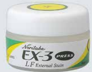
PINTURA EXTERNA EX-3 PRESS LF