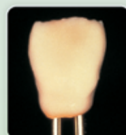
3. Aplicação de translucente após a queima do IS