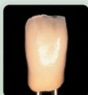
1. Queima da dentina e incisal