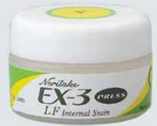
PINTURA INTERNA EX-3 PRESS LF