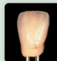
4. Coroa finalizada