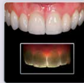
MDT Naoki Hayashi Porcelana CZR e CZR PRESS LF Restauração: 4 Elementos Anteriores