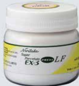
PORCELANA EX-3 PRESS LF DE BAIXA FUSÃO, 50G