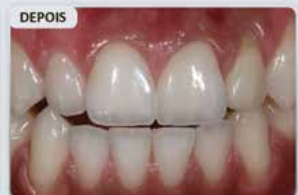
MDT Giovani Gambogi Porcelana: CZR PRESS E CZR PRESS LF