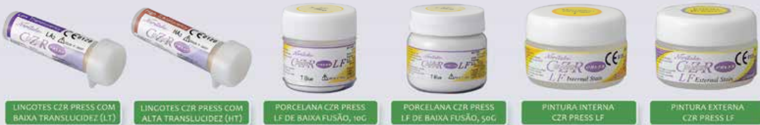
LINGOTES CZR PRESS COM BAIXA TRANSLUCIDEZ (LT)