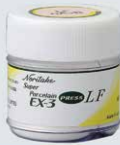
PORCELANA EX-3 PRESS LF DE BAIXA FUSÃO, 10G