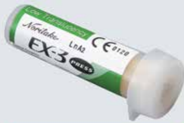
LINGOTES EX-3 PRESS COM BAIXA TRANSLUCIDEZ (LT)