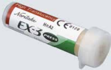
LINGOTES EX-3 PRESS COM ALTA TRANSLUCIDEZ (HT)